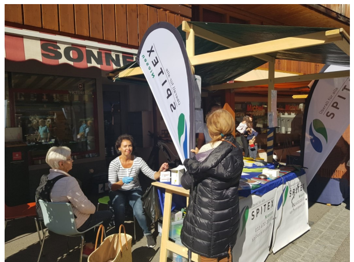
Stand in Adeboden